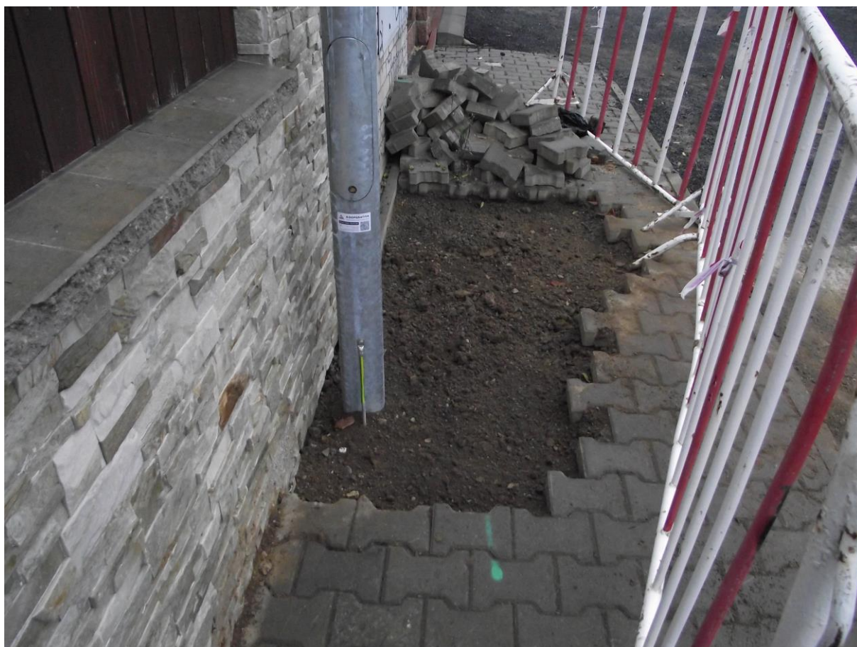
Obr. 1: Realizace nového VO

Jednotka věnující se správě VO i nadále zahrnuje 2 zaměstnance. Vzhledem k tomu, že od poloviny června do konce listopadu bylo průběžně budováno nové veřejné osvětlení, byly elektrikáři 100% využiti právě na tyto práce, ve druhém roce činnosti tak můžeme říct, že VO se věnují dohromady již na 1,6 úvazku. Ve zbývajícím čase jsou pak využíváni např. na drobné elektrikářské práce na objektech města apod. Naopak při budování nového veřejného osvětlení (zednické práce při výměně sloupů atd.) jsou využiti i jiní zaměstnanci TSÚ – při výstavbě osvětlení v Horoušánkách i U Hájovny byli do těchto prací zapojeni další 2-4 zaměstnanci, v závislosti na charakteru práce.