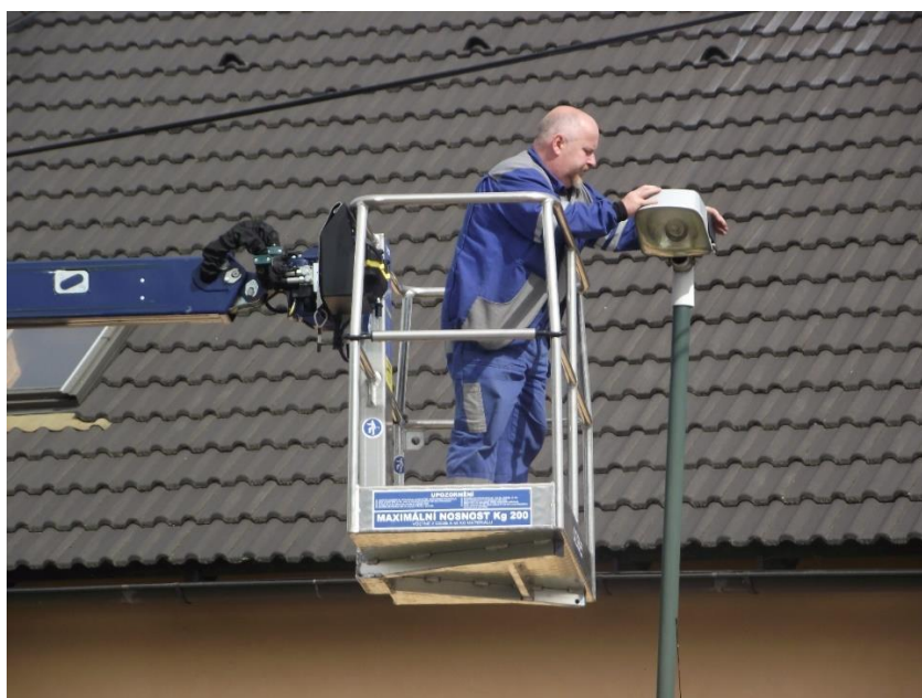
Obr. 2: Operativní údržba VO