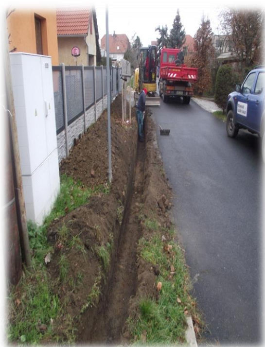
Obr. 1: Realizace VO – Slovinská

K zajištění oprav VO je využíváno vozidlo Mitsubishi FUSO s vysokozdviznou plošinou od firmy Rybáček. Oprava a údržba VO je zajišťována jednosměnnou 2 člennou posádkou. Tato posádka se také věnuje elektrikářským pracím na objektech Města Úvaly. Při budování nového VO jsou využíváni i další zaměstnanci TSMÚ např. k zednickým a výkopovým pracím. Každý rok TSMÚ zajišťují vánoční výzdobu města a přípravu adventní soboty.